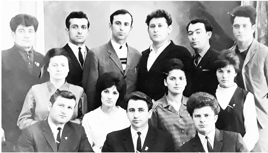
Ардонский комсомольский актив на областной конференции. 1967г.

Творчески используя опыт подготовки к 50-летию Великого Октября и Ленинского комсомола, комсомольские организации района развернули работу по достойной встрече 100-летия со дня рождения В.И. Ленина.